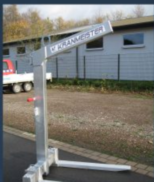
Automatischer Gewichts- ausgleich und wartungsfreies Druckfedersystem