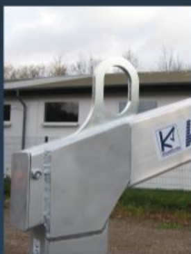
Einfaches Einhängen des Kranhakens