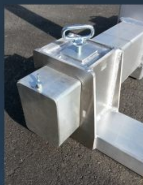
Verstellbare Gabelzinken, speziell geschweißte Profile für hohe Belastbarkeit