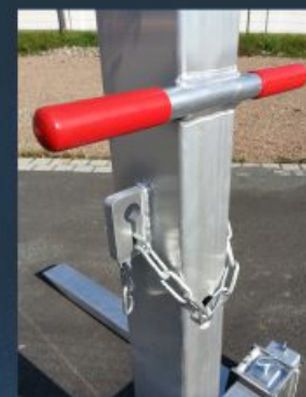
Praxisorientiert - gute Funktionalität und Handhabung